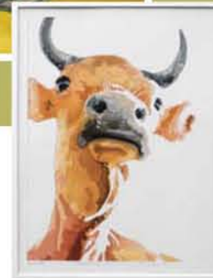
Koeportret in lijn 2, No 1. techniek: ets en aquarel.