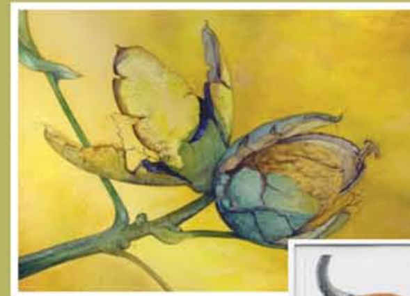
Walnoot in bolster. techniek: ets, crayon.